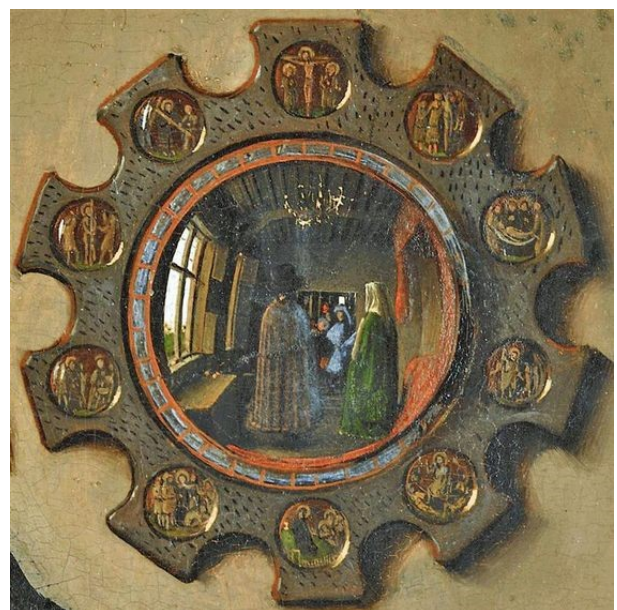
Jan van Eyck (1390 -1441): Arnolfini házasság, 1434

Asztali beszélgetések, Luther kiadó 2015.