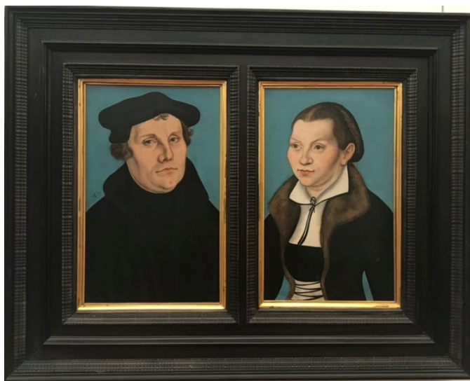
Id. Lucas Cranach (1472-1553): Martin Luther és Katharina von Bora kettős képmása, 1529 - Uffizi, Firenze.

A Luther-házaspár 1525-ben tartotta esküvőjét. 1531-ben, Luther egy asztali beszélgetés alkalmával következőképpen dicsérte a házasságot és feleségét: „ ő (Luther) ezt az asszonyt többre becsüli a francia királyságnál és a velencei köztársaságnál, mert ő ezt a derék nőt Istentől kapta ajándékba, ahogy emez is őt, Luther doktort. Másodszor ő hallott már sokkal nagyobb házi bajokról és torzsalkodásokról házastársak között, mint amit az ő felesége okoz. Harmadszor, már ez bőségesen elég indok volna őt szeretni és becsülni, hogy ragaszkodik a hitéhez, tisztességesen viselkedik, ahogy illik egy jóra való asszonyhoz. És ha mindezt egy férj szemügyre veszi és meggondolja, akkor ez a rész könnyűszerrel felülkerekedik, bármi for-duljon elis elő, és legyőz minden civakodást és nézeteltérést, melyet a Sátán szokott házastársak között kelteni és szítani. ”