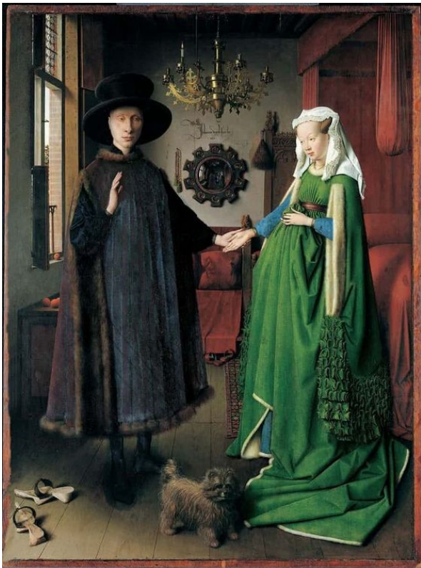
Jan van Eyck (1390 -1441): Arnolfini házasság, 1434

Teljes néven Publius Ovidius Naso , Augustus császár uralkodása alatt élt Kr.e.43 és Kr.u.17 között. Műveit a középkor óta ismerték Európában. Különösen a szerelemről szóló történeteit olvasták, festették és zenésítették meg előszeretettel a reneszánsz és barokk művészek (pl. Rubens, Rembrandt, Gluck és Haydn).