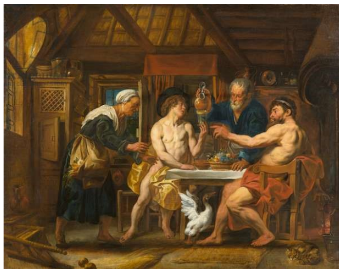
Jacob Jordaens (1593-1678): Philemon és Baucis, 1645

A római irodalomban, a hűségükről híres görög házaspár - Philemon és Baucis - történetét Ovidius jegyezte fel a Metamorfózis nevű verses kötetében.