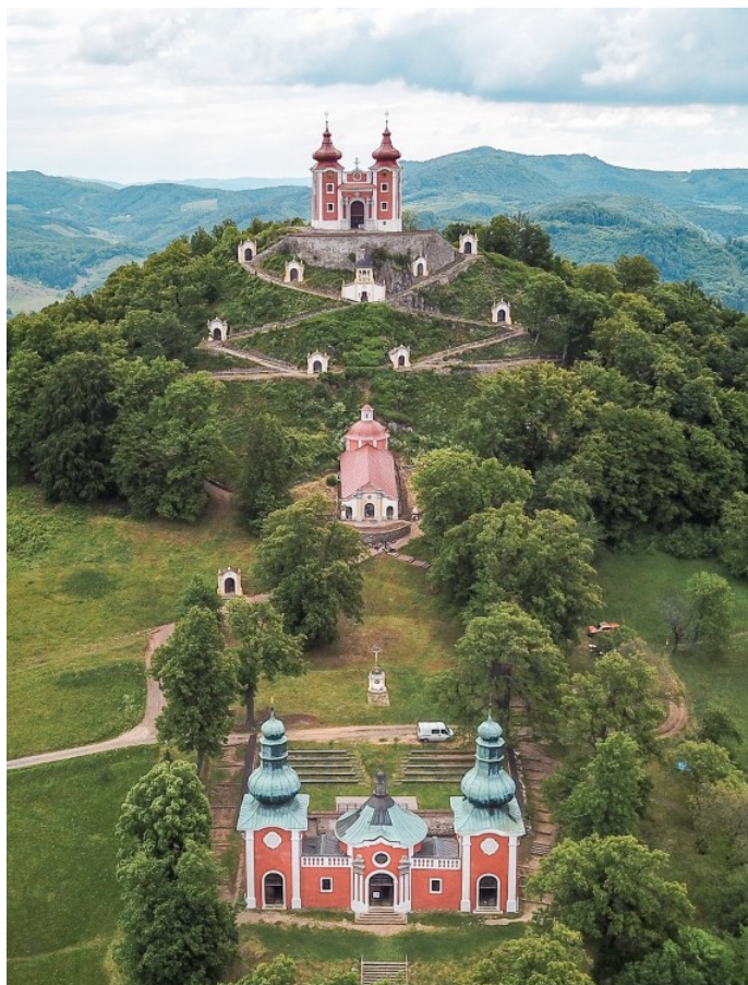
Selmechánya, Kálvária, 1745-1751.

Az evangéliumok leírása szerint Krisztust, a Jeruzsálem falain kívüli Golgotán (magyarul: a koponyák hegye) feszítették keresztre. Jézus a keresztjét az ítélet helyszínétől, azaz Poncius Pilátus római kormányzó palotájától, a latinul Kálváriának nevezett dombra vitte fel. Ezt, a szenvedéssel megtett másfél kilométernyi utat Via Dolorosának hívják, amelyen minden húsvét előtt keresztény zarándokok ezrei mennek végig, megemlékezve Megváltónk áldozatáról.