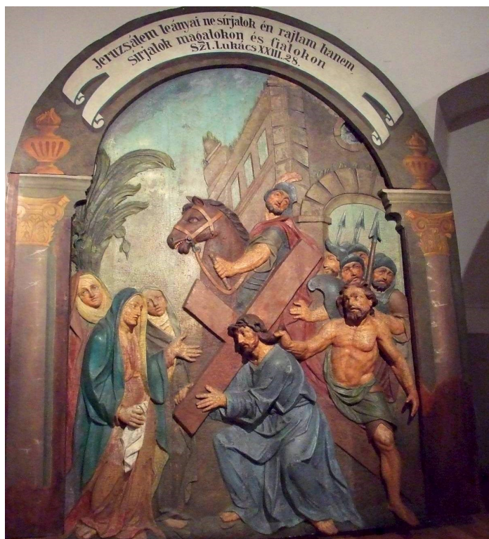
Selmecbánya, 8. stáció: Jézus szól a síró asszonyokhoz

Az egyes stációk képeinek minősége a megbízott művészek képességein múlott. Legtöbb helyen a jeleneteket színes féldomborművekkel oldották meg, amelyek háttérben festett tájak vagy épületek láthatók. Nagyon szép példa erre Giovanni Giuliani, (1664-1744) híres olasz szobrászművész munkája a Bécshez közeli Heiligenkreuz kálváriáján. Érdemes oda ellátogatni!