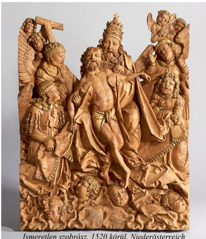
Ismeretlen szobrász, 1520 körül, Niederösterreich

A művészettörténet egyik különösen jelentős Szentháromság alkotása Albrecht Dürer 1511-ben készült nagy méretű fametszete (39 x28 cm). Ezen az Atyát egy idős úrként, tiaravál (pápai korona) a fején ábrázolta, amint holt fia testét tartja lábai között. A keresztet egy mellette álló angyal vette át több másik gyászoló angyal (fiatalemberek alakjában) társaságában. Mindnyájuk felett a Szentlélek-galamb lebeg. A jelenet az égben játszódik, hiszen lábuk alatt felhők láthatóak, köztük kerúb-fejek vannak elhelyezve. Ez a sorozatban nyomtatott és árúsított fametszet széles körben ismertté vált. Nem csak gazdag polgárok vásárolták meg ezeket a lapokat, hanem sok kortárs művész is. Mindnyájan inspirációnak és példaképnek használták Dürer csodálatos kompozícióit. Ezt a Mömpelgardi oltár több festett jelenetében is fel lehetett fedezni. A fent látható, fából faragott dombormú már a szobrászatba vette át a nagy mester alkotásának elemeit. A jelenet azonos, de a faragott alakok testszerűsége még érzékletesebben szemlélteti azt az isteni áldozatot, amit az Atya a hívők felé nyújt: a halott fiát.