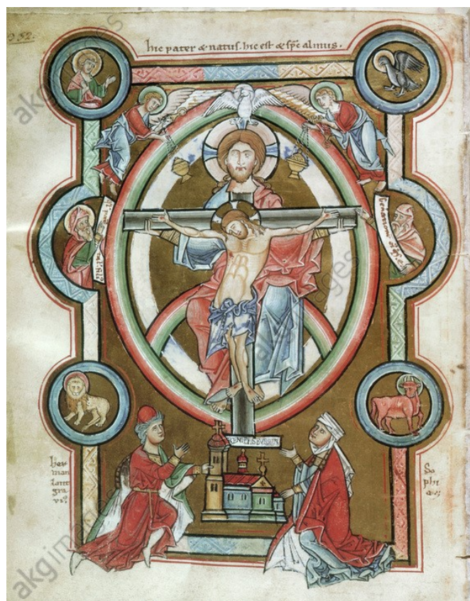
Árpád-házi Thüringiai Szent Erzébet Imakönyve, 1211 körül

A lent látható, pergamenre festett, Szentháromságot ábrázoló lap annak az imakönyvnek egyik képe, amelyet árpádházi II. András / Endre király leánya kapott ajándékba thüringiai férjének szüleitől. Erzébetet már 1211-től, azaz 4 éves korától Hermann tartományi gróf családjában nevelték, hogy végül 1221-ben az ifjú Lajos gróffal Eisenachban összeházasítsák. A kép alján Hermann gróf és felesége, mint templomalapítók térdelnek, a Szentháromságot körülvevő, mandula formájú ún. „mandorla“ alatt. A mandorla motívum - egy az egész Krisztus-alakot körülvevő dicsfény vagy glória - a bizánci, azaz kelet-római keresztény művészetben jelent meg először. Ezt az ún. Majestas Domini (az Isten dicsősége) ábrázolást innen vette át a középkori német könyv- és ötvösművészet is. Az imakönyvben nemcsak Krisztust, hanem a Szentháromságot láthatjuk oly módon, hogy az Atya két kezében tartja a keresztet és rajta halott fiát, Jézust. Fölötte a Szentlélek-galamb lebeg. Ezt a