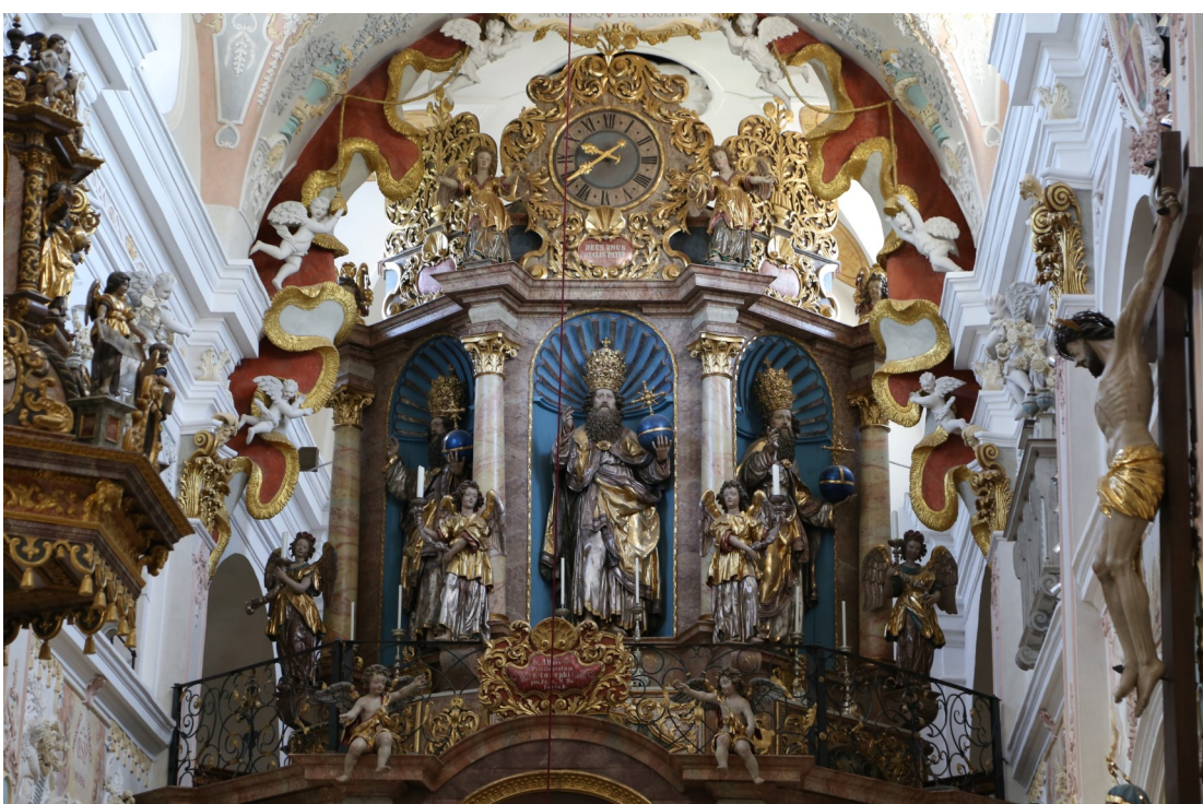
Szentháromság oltár, 1660, Weihenlinden, Bajorország