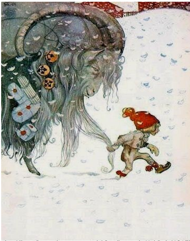
John Albert Bauer (1882-1918) svéd festő, mesés Yul Bok (1917)

Felgyógyulva én is egy sapkás karácsonyi manónak képzeltem magam, amikor már kimehettem a szomszéd gyerekekkel szánkózni a közeli domboldalra.