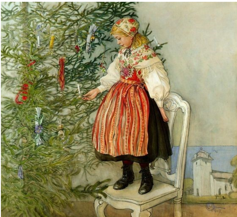
Carl Larsson: Kislány svéd népviseletben a karácsonyfát díszíti.