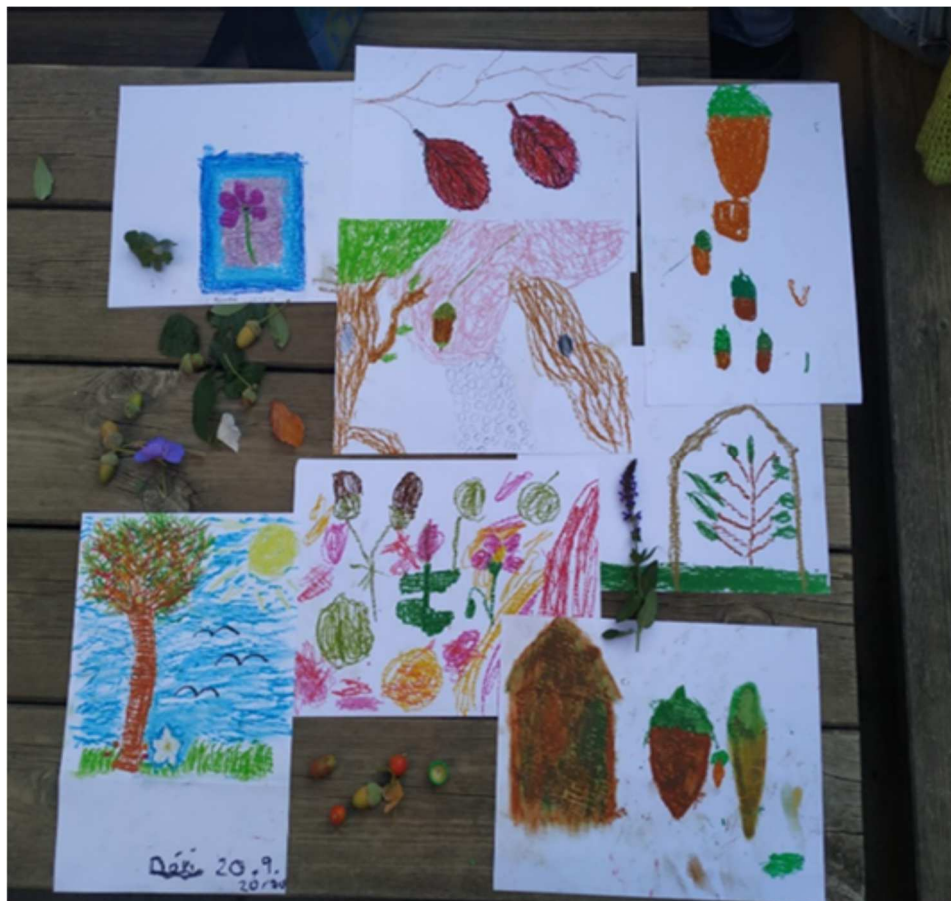
Az Ausztriai Magyar Evangélikus Gyülekezet gráci gyermekeinek munkái.