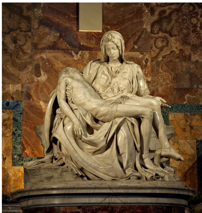
Pietà 1498-99, Michelangelo Buonarroti