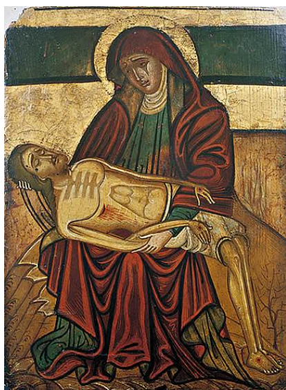
Ismeretlen festő, Siena, 14. század

A 14. századtól kezdve már a liturgiában, az ikonográfiában, a legendákban és a szakrális folklórban egyaránt megjelent és mindjárt különleges helyet foglalt el a mater dolorosa , azaz a Fájdalmas Anya alakja. Ezért szeretném itt megemlíteni a magyar versköltészet első emlékét is, az Ómagyar Mária-siralmat (1300 körül), amelyben a szenvedéstörténet azon pillanatát írja meg az ismeretlen költő, amikor Jézus már halottan függ a keresztfán és annak tövénél a Fájdalmas Anya kesereg. A verssorok ritmikus szövegét, egy korabeli színjátékszerű előadás közben énekelhették el. Utolsó versszaka mai magyar nyelven így hangzik: