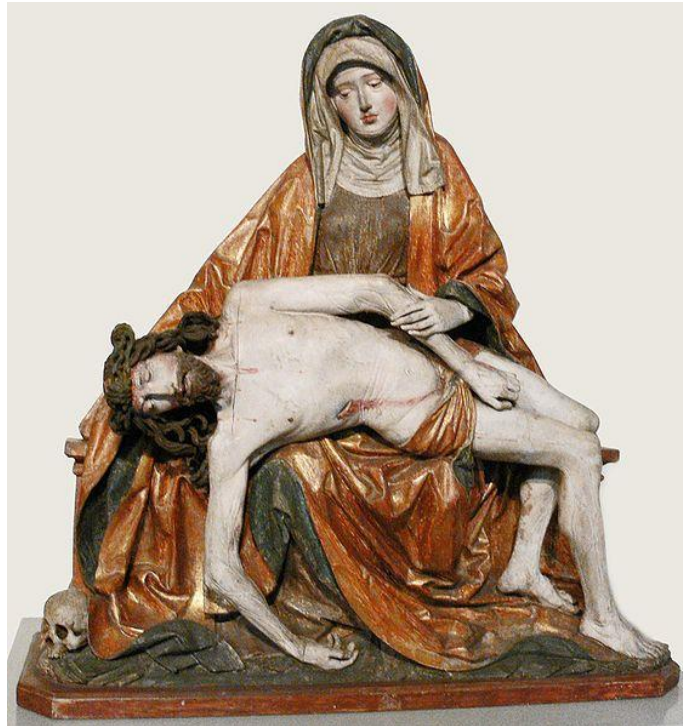
Pietà 1500 körül (déli német)

E két késő-gótikus szobor Mária alakját két ellentétes élethelyzetben mutatja be egyszülött Fiával. (Mindkét műalkotás a német eredetű, úgynevezett Andachtsbild kategóriába tartozik, egy képcsoporthoz, amely előtt a hívő áhítattal elmélkedhetett a megváltás-történetéről.)