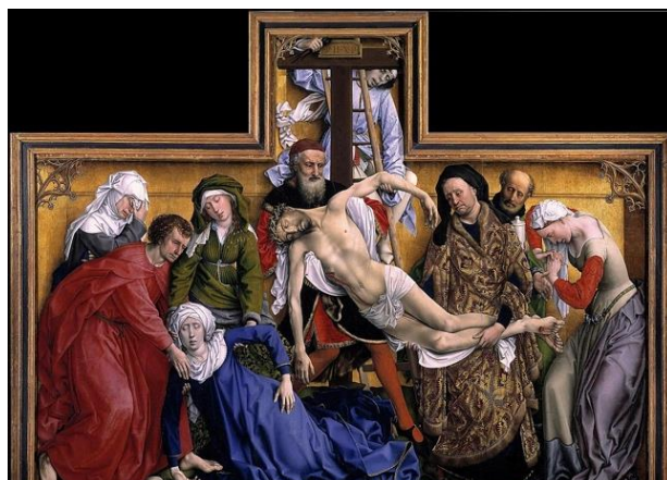
Roger van der Weyden, Prado, Madrid

A Jézus holttestének hullámszerű vonalvezetésével párhuzamosan földre omló Mária-alak igen beszédesen szemlélteti a Fájdalmas Anya elviselhetetlen szenvedését. A kép szélein látható két siratóasszony könnyei és testtartása is valós érzelmeket közvetítenek. A ruhák dekoratív redőzése és színvilága nem csak a németalföldi festészet korabeli stílusára jellemző, de jelzés értékük is van. Máriát mindig azúr-kék, János apostolt piros ruhában ábrázolták.