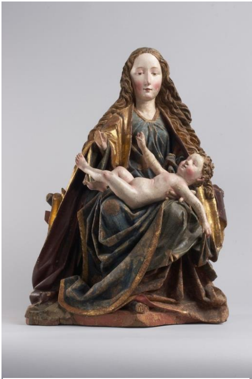
Madonna 1450 körül (déli német)

A Pradoban levő oltárkép az alábbi két Mária-szoborral együtt az áhítatos szemlélő érzelmeire kívánt hatni. Alkotóik az esztétikai szempontok figyelembevételével egyre érzékletesebben láttatják a boldog Madonnát vagy Mária kábult fájdalmát és megtörtségét.