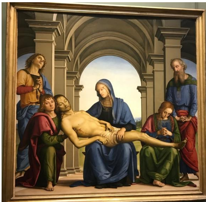
Pietro Perugino, Pietà 1493-94 (Uffizi, Firenze)

E két késő-gótikus szobor Mária alakját két ellentétes élethelyzetben mutatja be egyszülött Fiával. (Mindkét műalkotás a német eredetű, úgynevezett Andachtsbild kategóriába tartozik, egy képcsoporthoz, amely előtt a hívő áhítattal elmélkedhetett a megváltás-történetéről.)